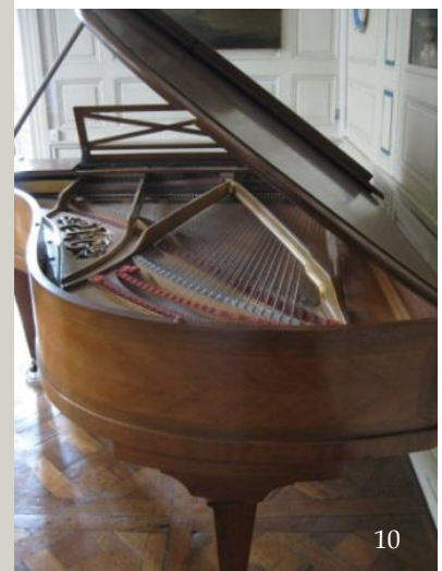
Piano demi-queue Pleyel de Pierre Bassot, 1927, n° 182 956. Étendue du clavier : 7 octaves et une tierce (la-do) soit 88 notes. Cordes croisées. Dotation initiale du Fonds Pierre-Bassot, 2009.