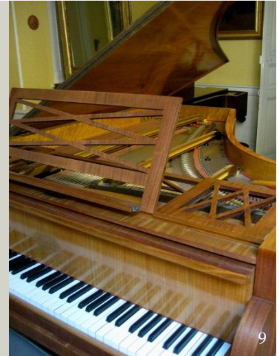
Piano grand quart de queue Érard, 1908, n° 94 361. Étendue du clavier : 7 octaves (la-la) soit 85 notes. Cordes parallèles. Don au Fonds Pierre-Bassot sous réserve d'usufruit, 2009.